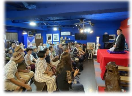
「つるま法律倶楽部 納涼寄席」 7月30日 35名参加