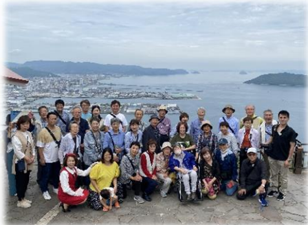
「大塚国際美術館と二十四の瞳でおなじみの小豆島の旅」 5月27日～29日。旅行記は7頁に掲載