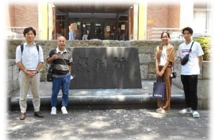
「夏の法廷見学」7月28日